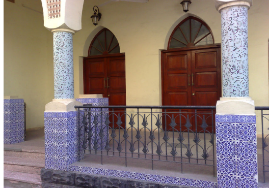
مأتم العريض في المنامة

أقول: يذكرني هذا بالسؤال الذي طرح على مجموعة من الطلبة في إحدى الدورات العلمية، وكان المطلوب ذكر اسم أذكى شخصية لعقلية بشرية.