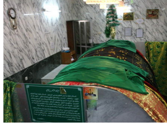
ضريح النبيه صالح

ومن الطريف يذكر أن هناك عقاب أو مكروه سوف ينزل بمن أخذ شيئاً معه عند الرجوع إلى الديار، فيحكى أن هناك أشخاص من الزوار أثناء رجوعهم أخذوا القليل من رطيبات النخل الموجود في جزيرة النبيه صالح، فانقلب بهم القارب عقاباً لهم على فعلتهم (١) .