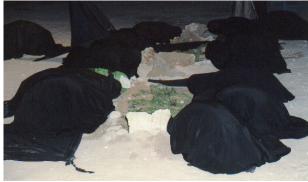
السجود والاستغانة بالقبور