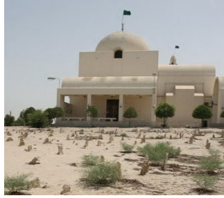
مسجد ضريح أمير زيد بمنطقة المالكية

ومن زمن بعيد كان أغلب أهل السنة في البحرين بسبب غياب الوعي يشدون الرحال لمثل هذه الأضرحة، من أجل النذر لصاحب الضريح، كضريح الأمير زيد بمنطقة المالكية، وضريح النبيه صالح في جزيرة النبيه صالح، وضريح الشيخ إبراهيم، وضريح صعصة في قرية عسكر...، وغيرها من الأضرحة، ولكن بعد الصحوة الإسلامية التي انتشرت في