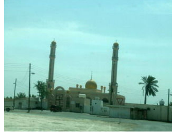
مسجد النبيه صالح في الجزيرة