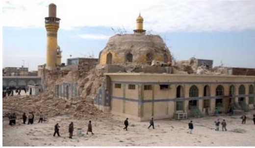
صورة بثت في وسائل الإعلام

عنها الكثير من القتل والدمار، إلا أننا لم نشاهد أن الأئمة استطاعوا رد الضر عن أنفسهم أو عن غيرهم.