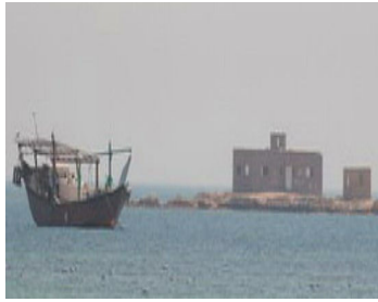
ضريح الشيخ إبراهيم في وسط البحر

أواخر السبعينيات من القرن الماضي، أدرك الناس أن هذه الممارسات من أفعال المشركين فامتنعوا من ذلك والله الحمد؛ وذلك أن أهل السنة اتبعوا ما أمر الله به (١) ، وما أمر به رسوله ﷺ (٢) ، وما نُقل عن الآل والأصحاب - رضي الله عنهم أجمعين -.