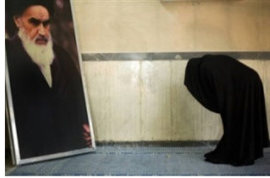
الركوع لصور العلماء