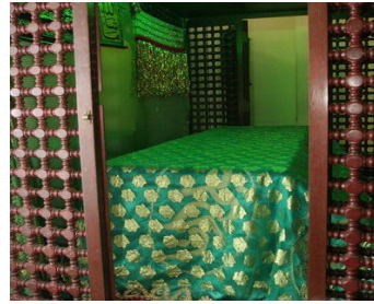
ضريح صمصعة في قرية عسكر