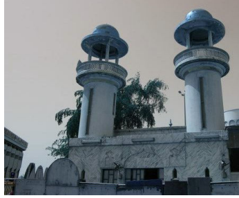
مسجد الشيخ عزيز منطقة السهلة الشمالية