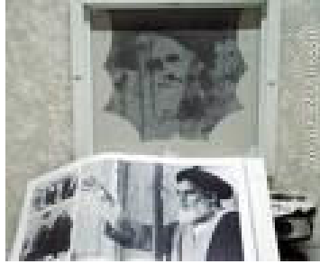
الصورة في إطار زجاجي

وفي أوائل القرن الحادي والعشرين وقعت حادثة مماثلة تحت عنوان (الأسمنت يرسم بعفوية صورة الخميني على الجدار)، جاء في الخبر... «تفاجأ مواطن بحريني من الطائفة الشيعية بوجود رسم يقارب إلى حد كبير صورة الخميني على جدار غرفة جديدة يبنها في بيته الواقع بالدوار الرابع بمدينة حمد، وعلى رغم أن الدلائل تشير إلى أن الرسم عفوي من جراء سيلان الإسمنت على الطابوق أثناء عملية مسح الجدار، إلا أن المواطن ولجبه للخميني لم يصبغ مكان الرسم ووضع إطاراً زجاجياً حوله ليتحول إلى منظر يقصده العشرات من الزوار! حقاً أنها تجارة مربحة».