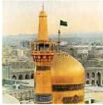
مرقد الإمام الرضا رحمه الله في إيران

فالجهلة من الممكن تعليمهم، والفقراء من الممكن رفع مستواهم المادي بشكل من الأشكال، ولكن المصيبة تكمن في الذهنية الموجودة في أوساط المثقفين والمتعلمين.